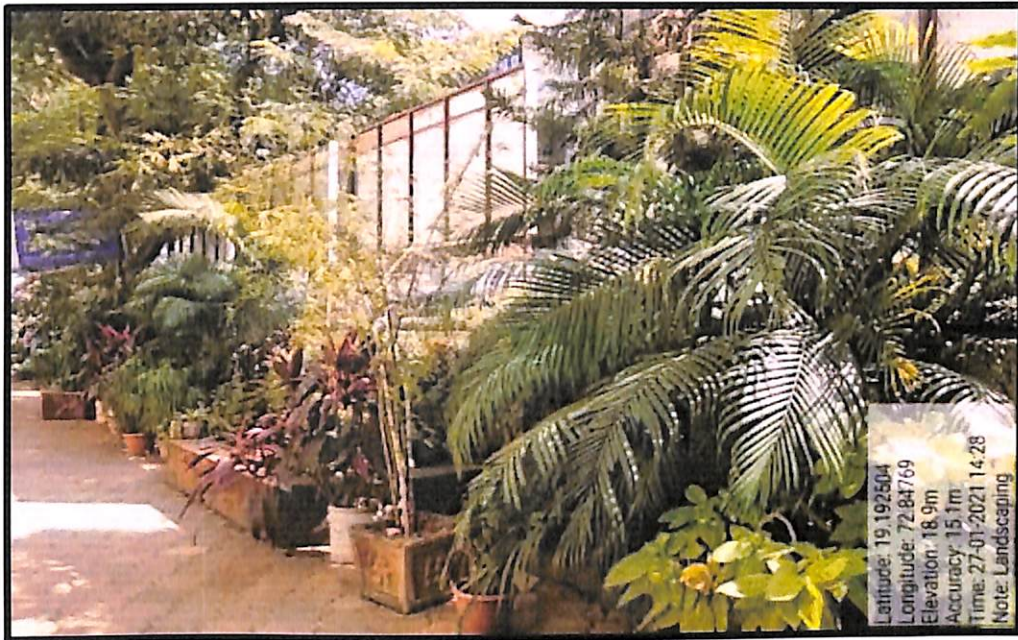
Landscaping Near Gate No 4 and 5