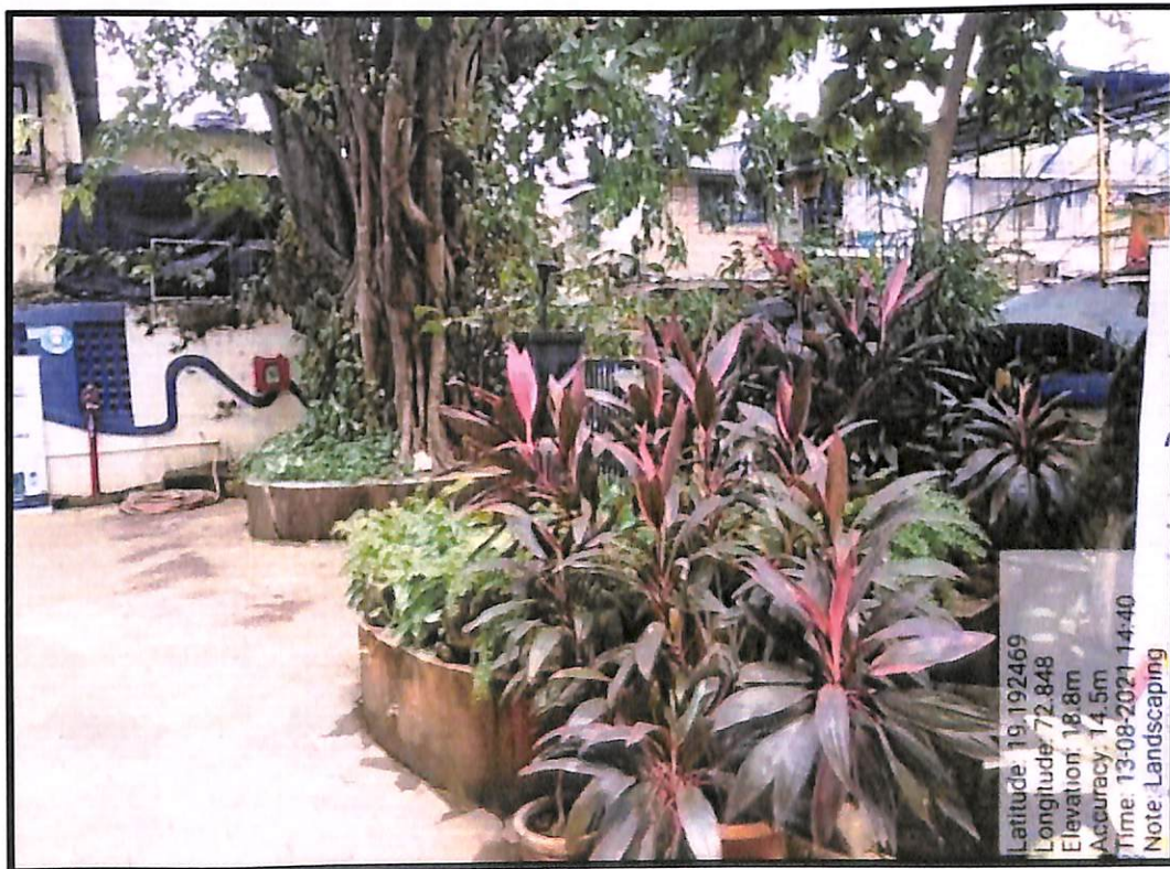
Landscaping Near Gate No. 6