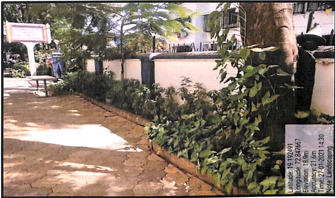
Landscaping Near Gate No 5