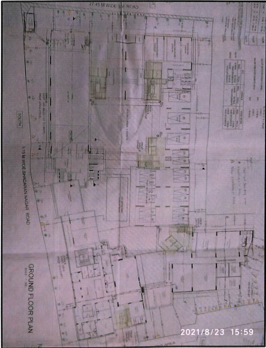
Ground Floor Plan mapped with Tree Planted with numbers

PRINCIPAL NAGINDAS KHANDWALA COLLEGE OF COMMERCE ARTS & MANAGEMENT STUDIES AND SHANTABEN NAGINDAS KHANDWALA COLLEGE OF SCIENCE (AUTONOMOUS) MALAD (W), MUMBAI - 400 064