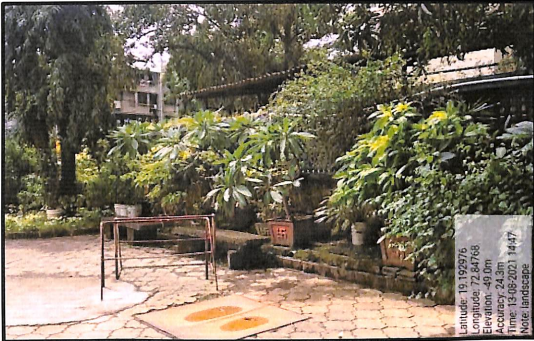
Landscaping near Gate No. 1