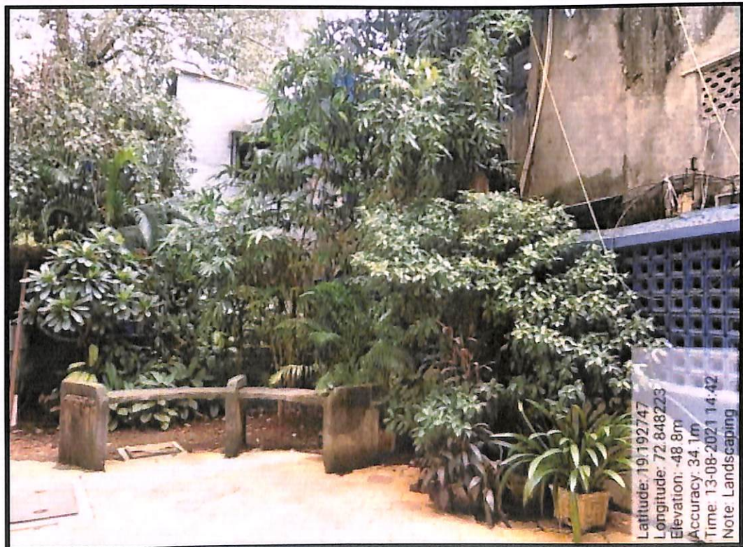
Landscaping Near Canteen