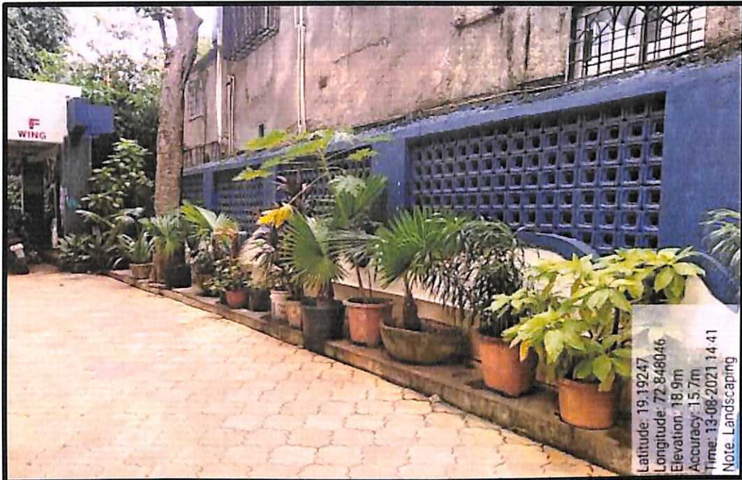
Landscaping Near "F-Wing"